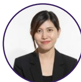
Lạc Bội Thơ

SĐT +84 28 3910 9100 – Ext: 9241 E My.Dang@vn.gt.com